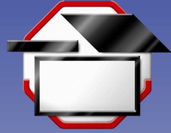
DACH + FASSADE FACHHANDEL