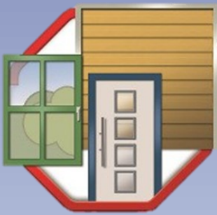
FACHHANDEL FÜR FENSTER TÜREN TORE